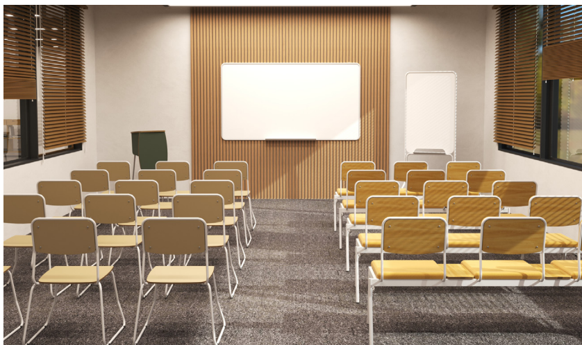
*Imagens meramente ilustrativas.